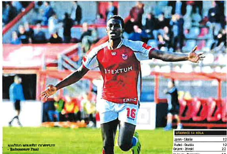
NAJVEĆI NEPOKRETLI ČINOVNIK - Buhnjarski Paal

Krimejčani se nisu predavali. U prvoj minuti sudačke nadoknade vremena Prpić je izbio i drugi kazneni udarac, a Bubnjar pogodio za 2:2